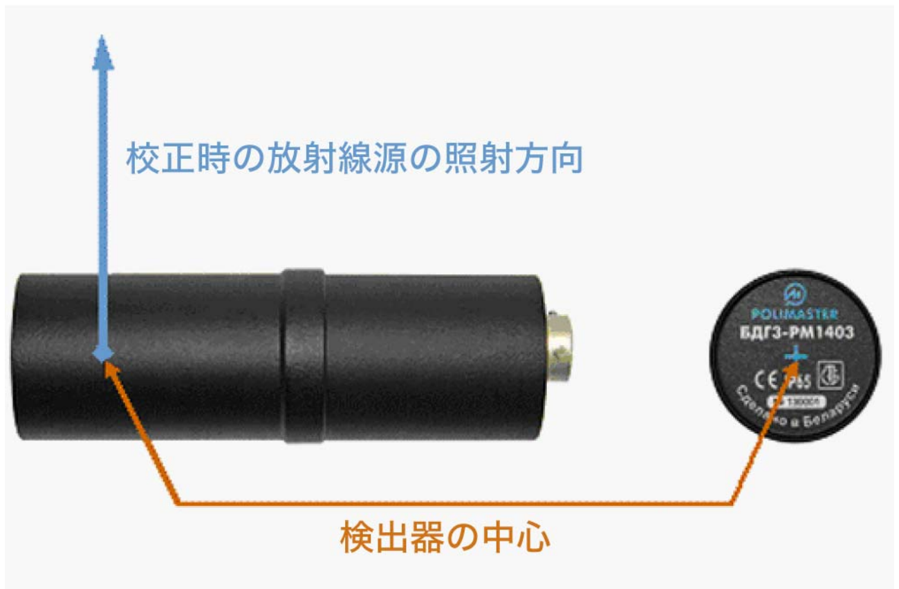
図 4.2 全体の寸法と校正の中心点